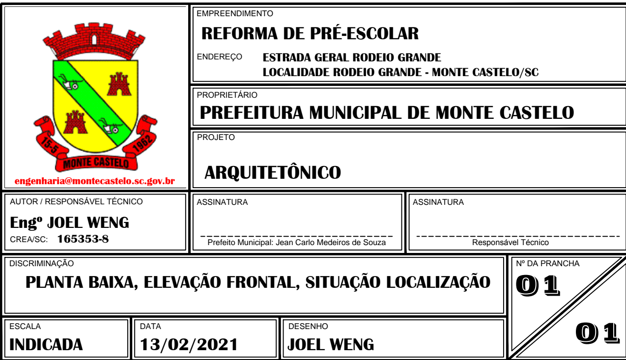
PLANTA DE SITUAÇÃO/LOCALIZAÇÃO ESCALA: 1:50