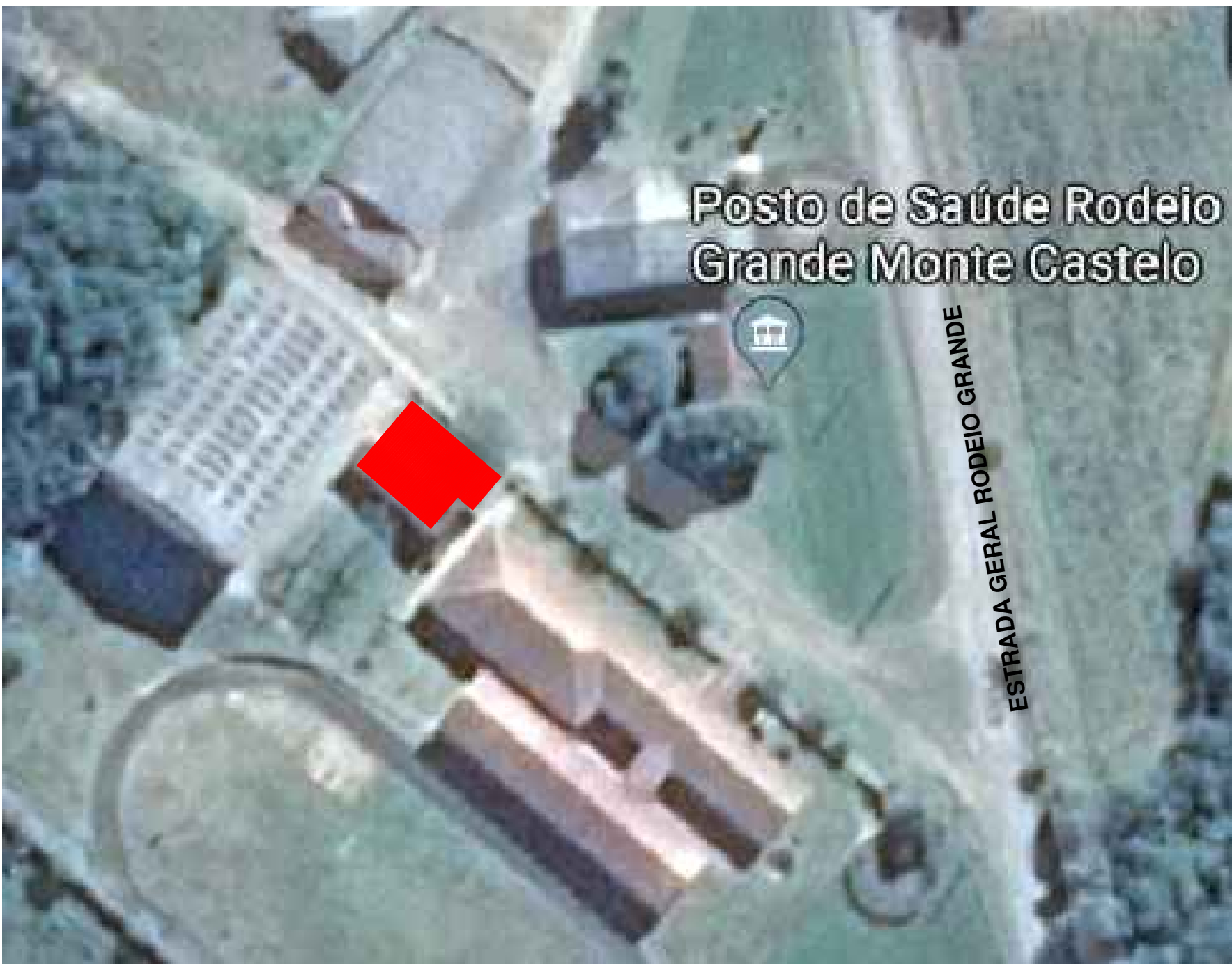
COORDENADAS -26.470310, -50.203365